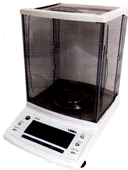
Рисунок 1 – Общий вид весов неавтоматического действия НТ

Принцип действия весов основан на преобразовании изменения частоты вибрации акустического весоизмерительного датчика, возникающего при его деформации под действием силы тяжести объекта измерений, в цифровой электрический сигнал, изменяющийся пропорционально массе объекта измерений.