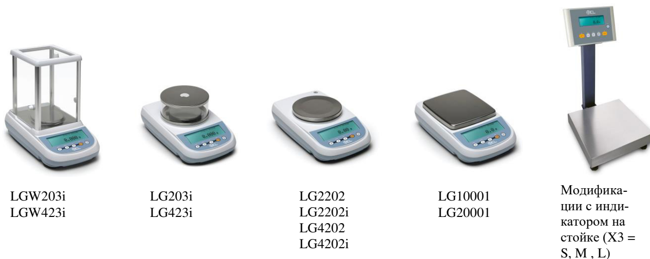
Рисунок 1 – Общий вид весов

Схема пломбировки от несанкционированного доступа представлена на рисунке 2.