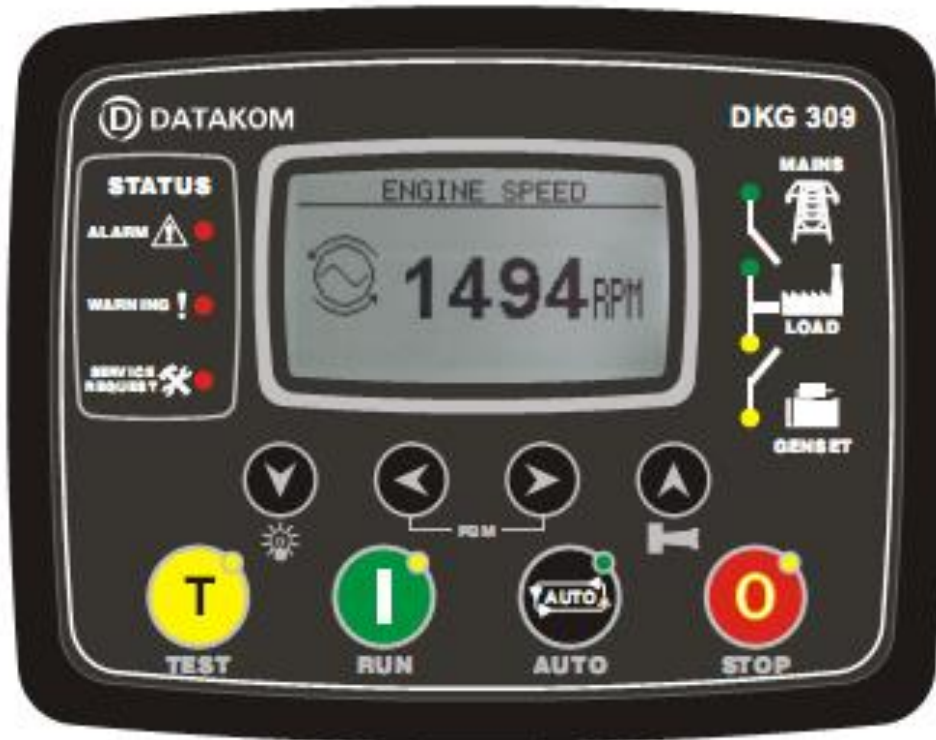
Рис.2. Панель блока управления DKG-309

STOP – выключено. В этом режиме дизель-генератор будет выключен.