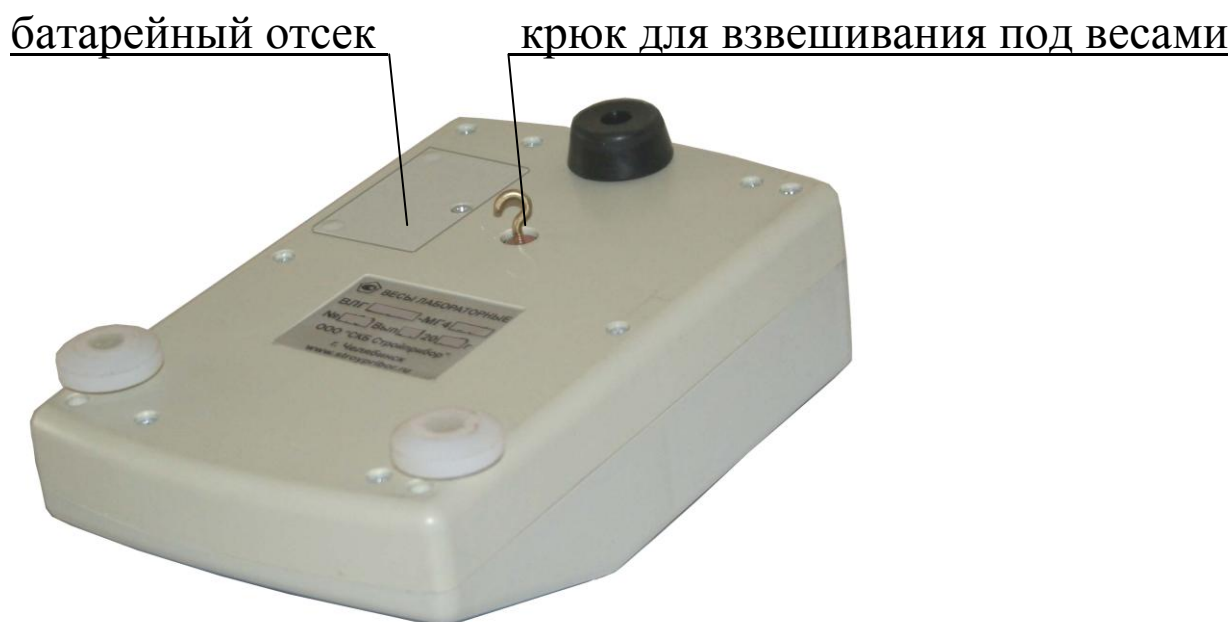
Рисунок 2 - Вид нижней крышки весов ВЛГ-МГ4.01