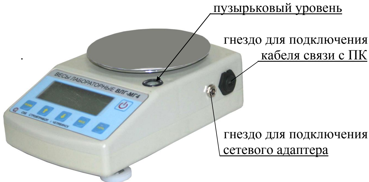
Рисунок 1 - Общий вид весов ВЛГ-МГ4, ВЛГ-МГ4.01 с НПВ до 3000 г