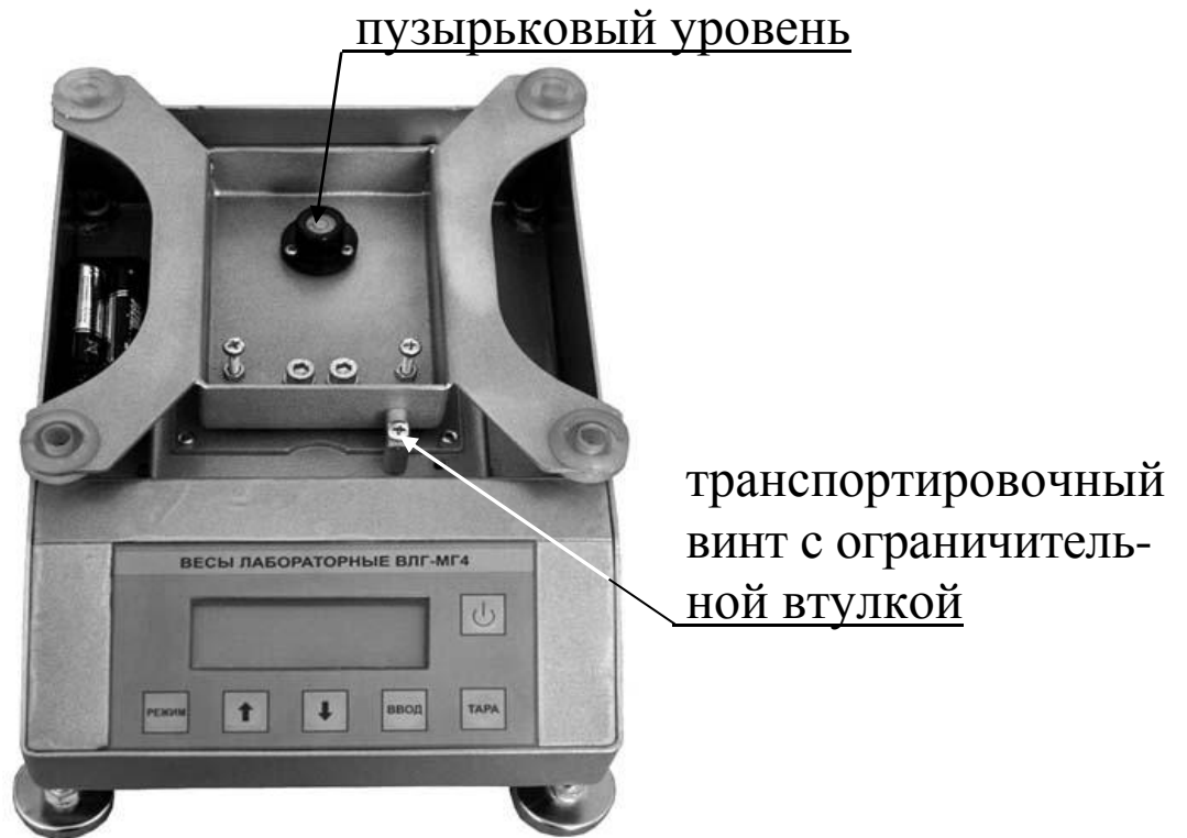
Рисунок 3 – Вид весов ВЛГ-МГ4, ВЛГ-МГ4.01 с НПВ от 5000 г до 10000 г со снятой платформой