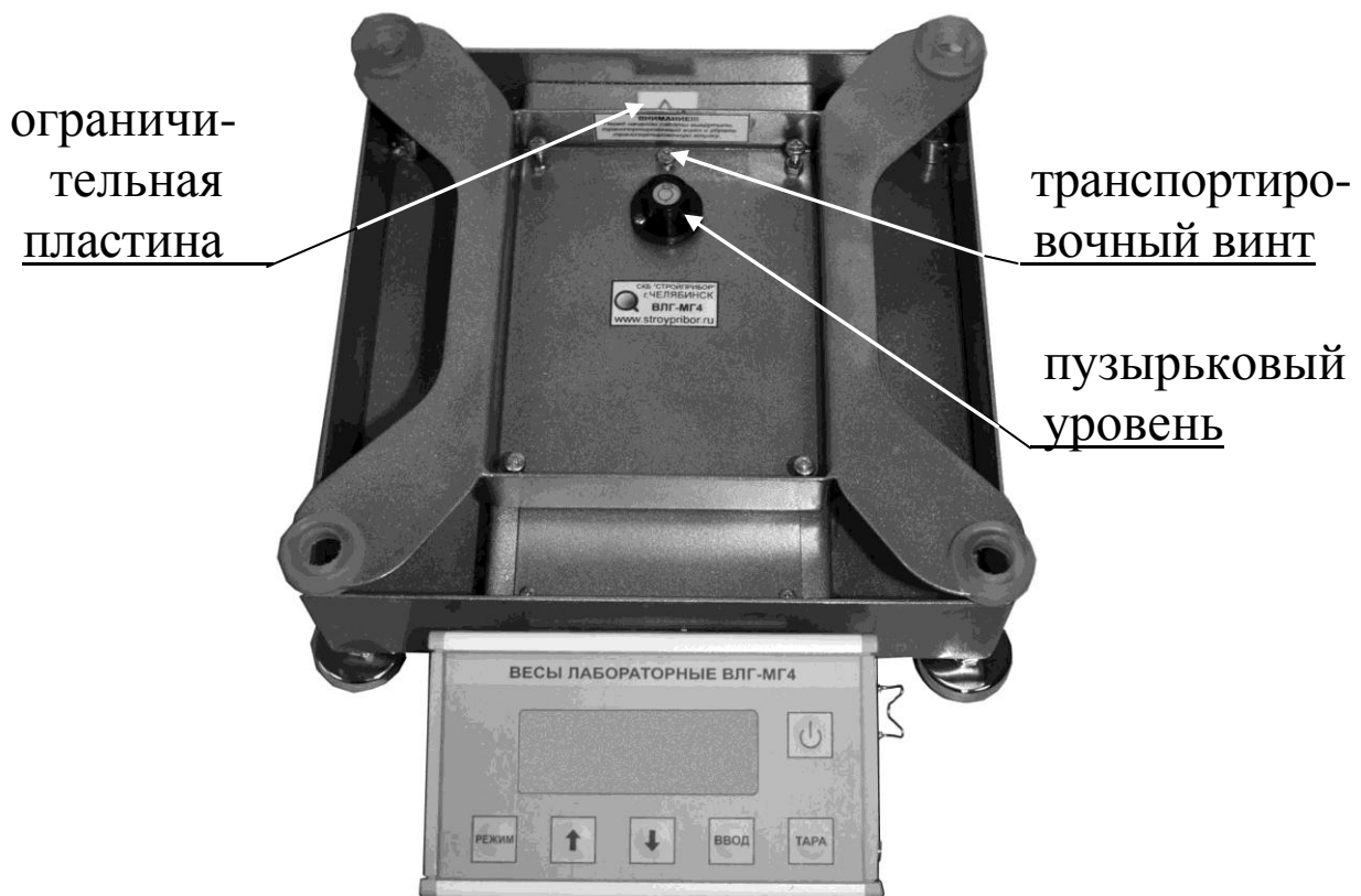
Рисунок 4 – Вид весов ВЛГ-МГ4, ВЛГ-МГ4.01 с НПВ от 10000 г со снятой платформой