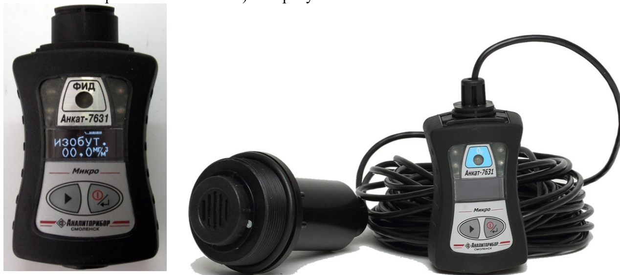
а) все модификации, кроме АНККАТ-7631Микро-О 2 -ВД

Общий вид газоанализаторов АНККАТ-7631Микро представлен на рисунке 1, схема пломбировки газоанализаторов от несанкционированного доступа (обозначение места расположения гарантийной наклейки) – на рисунке 2.