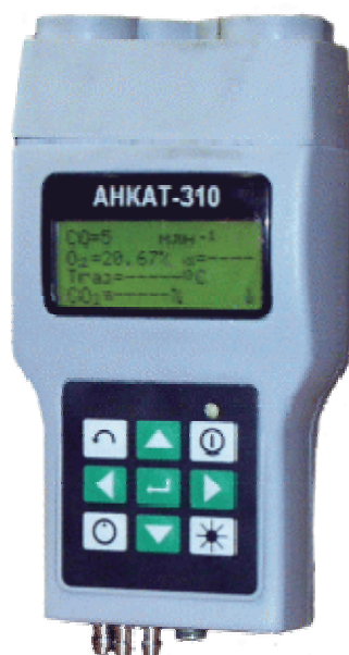
Рисунок 1 - Внешний вид газоанализаторов АНКАТ-310