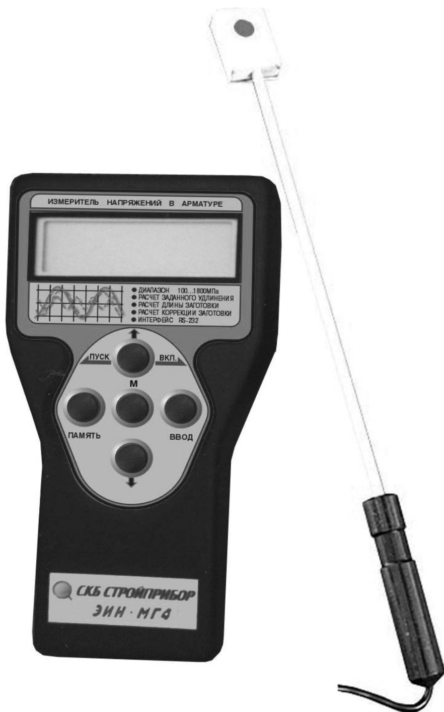
Рисунок 4.1 - Общий вид прибора ЭИН-МГ4