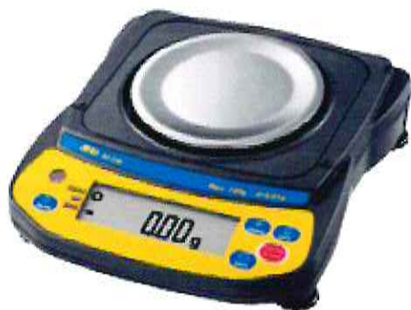
а) модификации EJ-120, EJ-200, EJ-300, EJ-610

Весы оснащены интерфейсами USB, RS-232C для связи с периферийными устройствами (например, персональный компьютер, принтер).