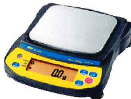
б) модификации EJ-1202, EJ-1500, EJ-2000, EJ-3000, EJ-3002, EJ-6100