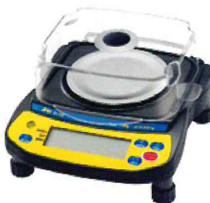
в) модификации EJ-123, EJ-303