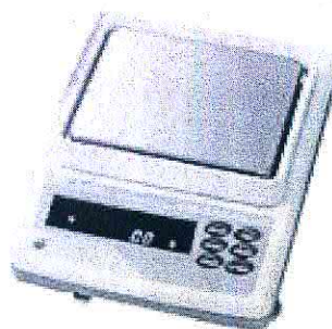
Рисунок 1 - Общий вид весов GF

Общий вид весов представлен на рисунке 1.