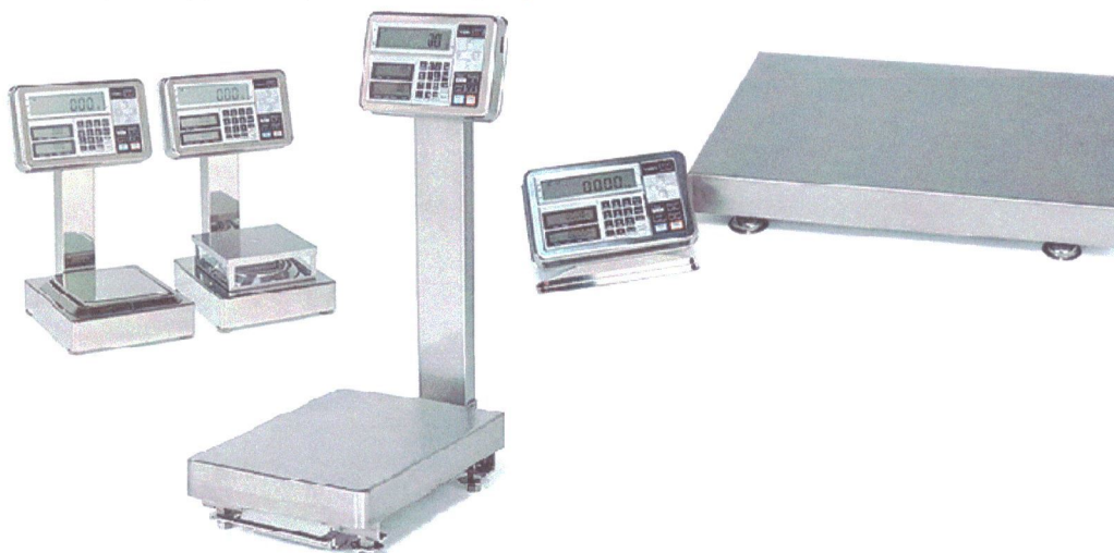
Рисунок 1 - Общий вид весов неавтоматического действия FS, FZ

Весы снабжены следующими устройствами и функциями (в скобках указаны соответствующие пункты ГОСТ OIML R 76-1-2011):