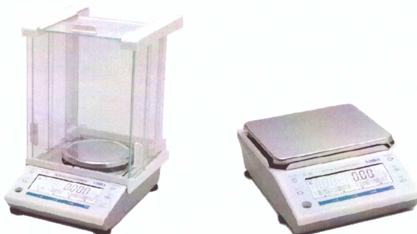
Рисунок 1 - Общий вид весов неавтоматического действия ALE

Общий вид весов представлен на рисунке 1.